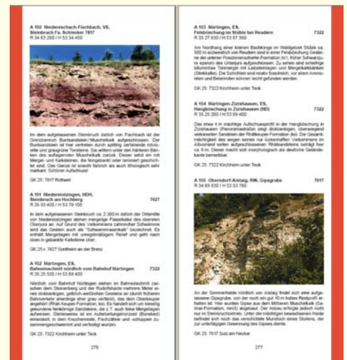
Abb. 4: Inhaltsseiten der Erläuterungen