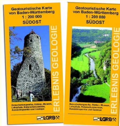
Abb. 3: Titelblatt von Karte und Erläuterungen

Die Geotouristische Karte von Baden Württemberg, Blatt Südost, sowie die Blätter Nord und Südwest können zum Preis von je 11,80 € im LGRB-Shop unter https://produkte.lgrb-bw.de/ oder im Buchhandel bestellt werden.