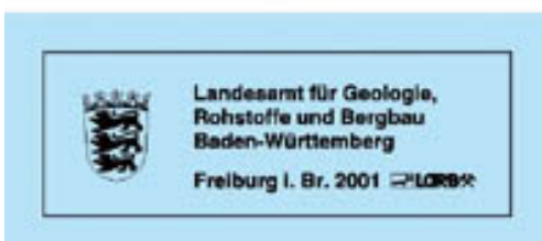
Titelblatt Heilbronn und Umgebung