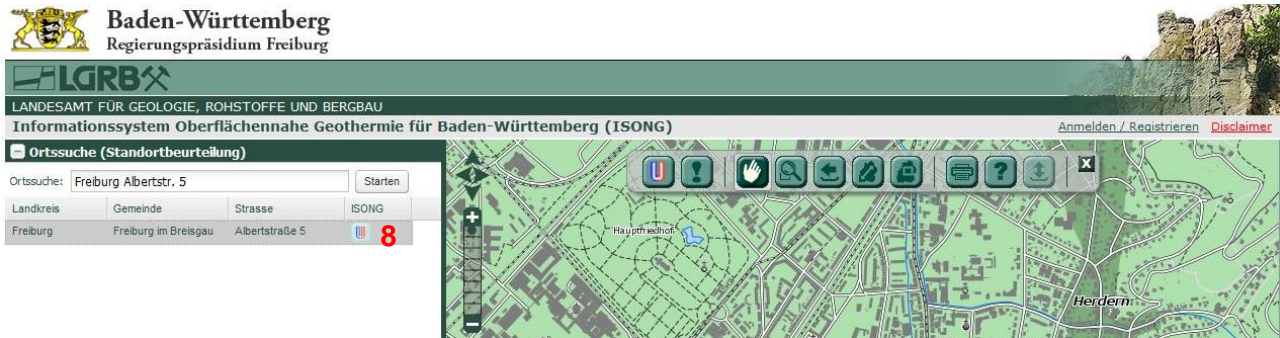
Bildschirmabzug Ortssuche (Standortbeurteilung) (siehe Erläuterung zu Punkt 8 im Text)

Nach dem Start der Ortssuche wird unter dem Eingabebereich der gefundene Standort aufgelistet (bei nicht eindeutigen Angaben erscheint eine Auswahlliste). Der Kartenausschnitt fokussiert auf den gefundenen Standort.